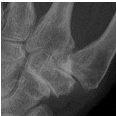
Röntgenfoto waarbij beginnende slijtage en een verzakking van het CMC1 gewricht en slijtgage van het STT gewricht is te zien