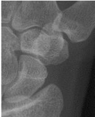
Röntgenfoto van een normaal duimbasis en polsbotgewricht