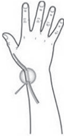
Tunnel waardoor de pees loopt