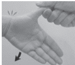
Test van Finkelstein

Indien op dat moment veel pijn optreedt aan de duimzijde van de pols wijst dit op een (pees)schede ontsteking van de Quervain. Er is slechts zelden aanvullend onderzoek nodig. Soms wordt ook de test van Finkelstein uitgevoerd. Hierbij wordt de duim gestrekt en naar achteren geduwd en de hand gekanteld richting de pinkzijde. Indien hierbij dezelfde klachten optreden als bij de Eichoff test wijst dit wederom op een (pees)schede ontsteking van de Quervain.