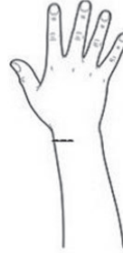
Tunnel waardoor de pees loopt